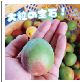
応募者：梅ジュース補給中さん

夏の練習後、真っ先に求めるのは「安中の青梅」で作ったキンキンに冷えた梅ジュースです。一口飲めば、梅本来の爽やかな香りが鼻を抜け、まるやかな甘みとスッパリとした後味が口いっぱい広がります。この「爽快な美味しさ」が、疲れた体に最高に染み渡るんです。